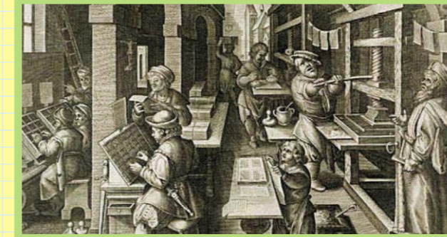
Bu günümüzde kullanılan yazıya gelişin başlangıcıdır.

Bu dönem grafik tasarım ve baskı teknolojilerine çığır açan buluşlardan biri gerçekleştirildi. Mainz'li Johannes Gutenberg (1400-1468) 1450'de bir kitabın tipografik tekniği ile basılabilmesine olanak sağlayan sistemi buldu. Gutenberg tipografik tekniğini geliştirirken, ilk kez Çin'de tahta kalıplara yüksek rölyef olarak ayılan ve "Xylotypography" adı verilen baskı tekniğinden esinlenmişti. Tipografik baskı tekniği ile ağaçbaskı resim sanatının işbirliği sayesinde Almanya'da resimli kitap basımı yaygınlaştı. Ağaçbaskı resimlemelerle ilk basılan kitap "Böhmen'li Çiftçi"dir (1460).