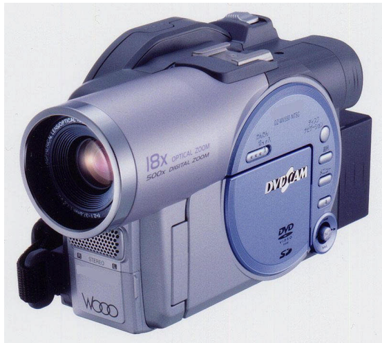
Resim 1.19: DVD kamera

DVD; televizyon ya da monitöre bağlanan bir DVD okuyucu ile izlenen video görüntülerinin depolandığı ortamdır.