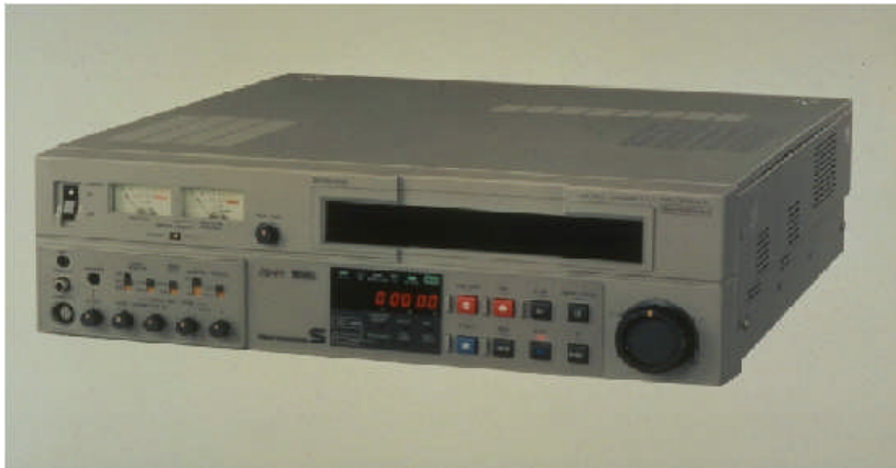
Resim 1.14: VHS video

Şunu belirtmekte fayda var ki VHS kameralarda yalnızca VHS kasetler, S-VHS kameralarda ise hem VHS hem de S-VHS kasetleri kullanılır.