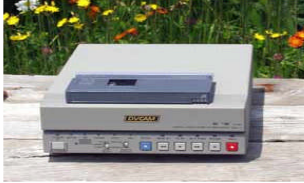
Resim 1.5: DVCAM kayıtçı

DV Video yaklaşık olarak 25 Mbit'lik veri taşır. Görüntü üzerine bindirilen ses, timecode, track bilgisi de eklenince bu defa 36 Mbit'e çıkar.