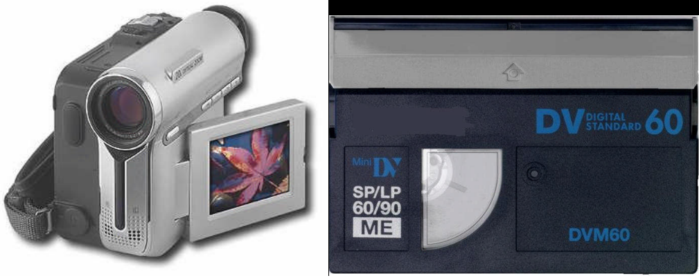
Resim 1.10 ve 1.11: Mini DV kamera ve kasedi

Mini DV'nin bir özelliği de dijital video kasetler kopyalanarak çoğaltıldığında çok az kalite kaybı olur.