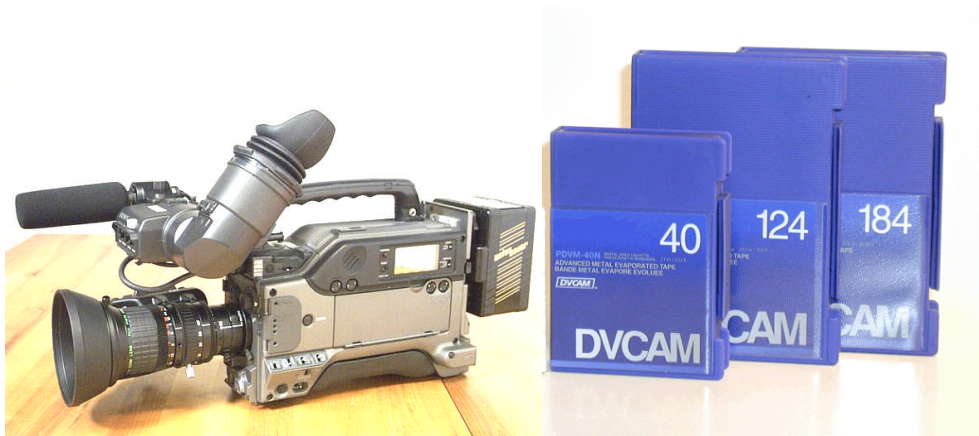
Resim 1.6 ve 1.7: DVCAM kamera ve kasetleri

DVCAM bant, görüntüyü dijital olarak 1/5 oranında sıkıştırarak kaydeder. Her kaset kurgu verimini artırır ve veriyi depolayan 16 kbit-1Cbit hafızaya sahiptir. Clip Link montaj aşamasında zaman kaybının önlenmesini sağlar. Ses kaydını 4 kanala çıkarabilme imkânı verir. Ayrıca bant üzerinde ses kanal sayısı 48'e çıkabilir. Örneklemeye 4:2:00 modunda yapılmaktadır.