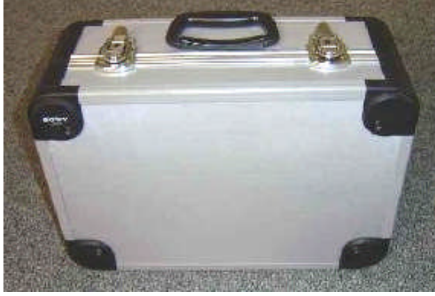
Resim 2.1: Çelik kamera çantası