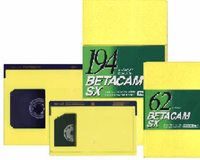
Resim 1.1: Betacam SX

Betacam SX dijital kayıt yapar. Analog sisteme göre daha kaliteli renk ve resim verirler. Aktarımda görüntü kaybı en aza indirilmiştir. Sıkıştırılmalı kayıt yaptıklarından az yer kaplarlar. Yayın sistemlerine bağlanma ve görüntü aktarma imkânları daha iyidir.