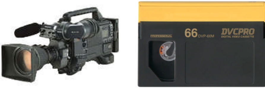
Resim 1.8 ve 1.9: DVCPRO kamera ve kasedi

DVCPRO bant üzerine, boylamasına analog ses izi ve kontrol izi eklenerek kurgu işlemlerinde kullanıcıya kolaylık sağlar.