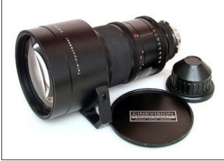
Resim 2.2: Objektif