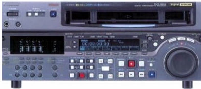
Resim 1.4: Dijital kayıtçı