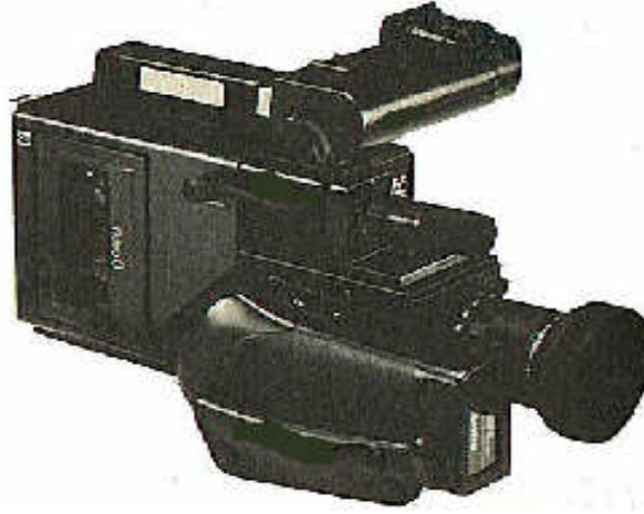
Resim 1.15: Hi8 video kamera

Bu kasetler amat3r ve yarı profesyonel diye adlandırılan Hi8 video kameralarda kullanılmaktadır. Piyasada 60'lık (Bir saat) ve 90 dakikalıkları bulunmaktadır. Bu kaset t3rlerinin ok iyi kayıt okuma olanađı vardır.