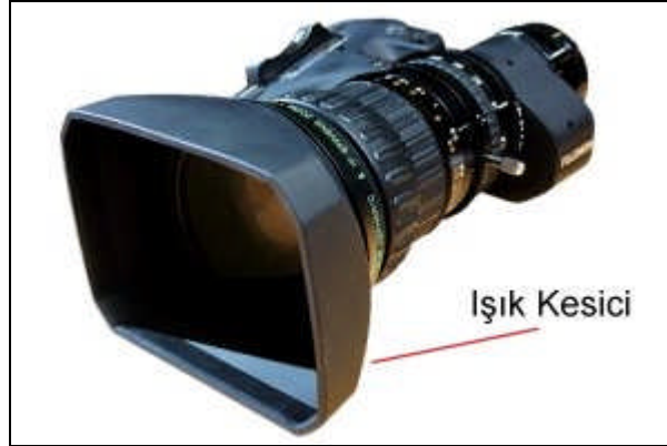
Resim 2.3: Parasoley