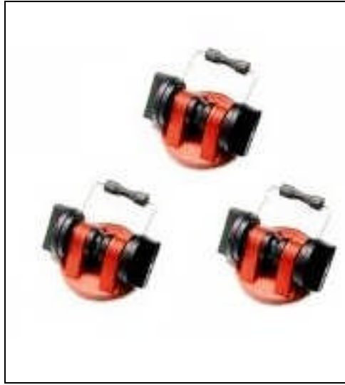
Resim 2.8: Palet

Dâhili mekânlarda çalışırken ayak çivileri, halı, parke gibi deęerli yer döřemelerinin üzerinde kayarak çizebilir. Lastik palet bu çizmeyi önler.