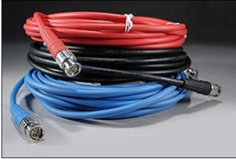
Resim 2.10: Kablolar