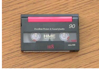
Resim 1.12: Hi8 kaset