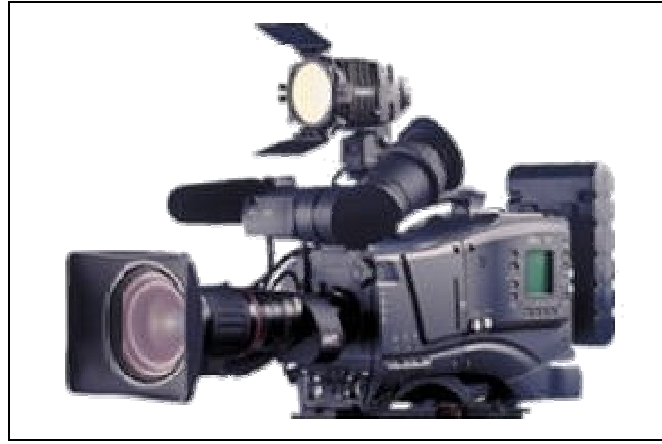
Resim 2.11: Flaş lamba

Video kameralar günümüzde 1 mum ışık ortamında bile çekim yapabilmektedir. Işığın yetersiz olduğu durumlar için tepe ışığı ve bataryası hazır bulundurulmalıdır. Tepe ışığı, enerjisini kameradan alabileceği gibi dışarı bağlanarak kablo aracılığıyla da enerji sağlanabilir.