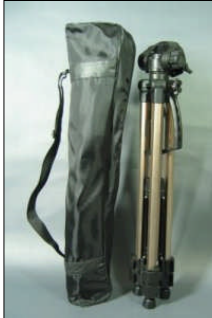
Resim 2.7: Ayaklık ve bez kılıf