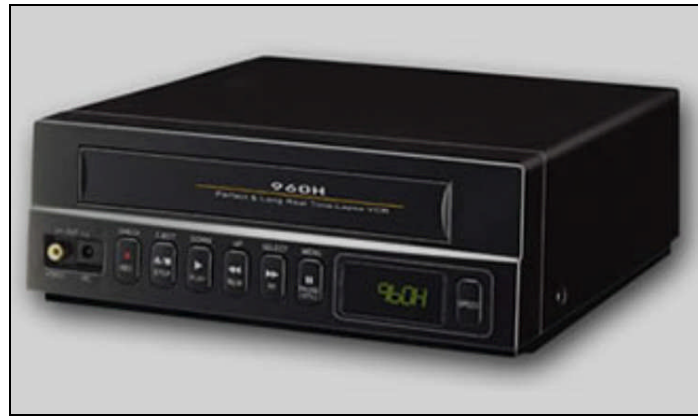
Resim 1.18: VCR okuyucu

Piyasadan kalkmakta olan yarım inç, amatör bir kayıt sistemidir.