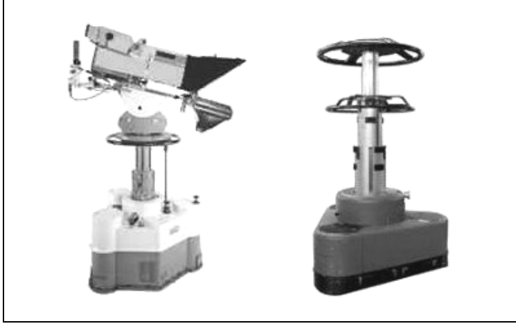
Resim 2.9: Pedestal