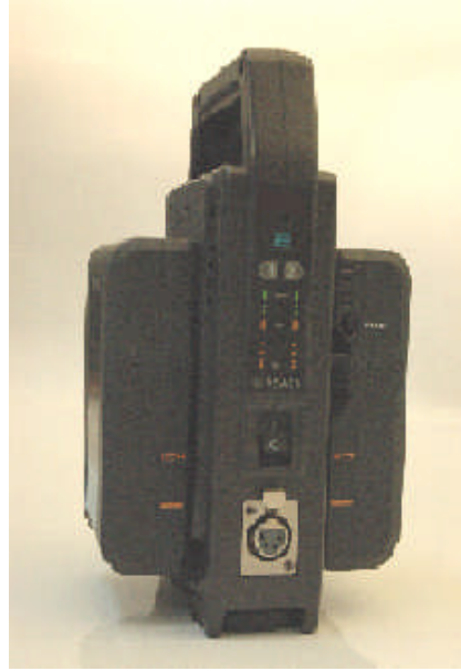
Resim 2. 4: Bir şarj cihazı ve üzerinde şarj olan bataryalar