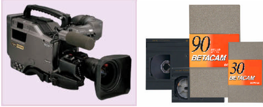
Resim 1.2 ve 1.3: Dijital Betacam kamera ve Betacam kasetler

Dijital kayıt sistemlerinin analog kamera sistemlerine göre avantajlarını şöyle sıralayabiliriz.