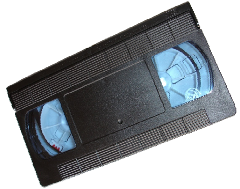
Resim 1.13: VHS Kaset

S-VHS'ler 1 saniyede 25 resim ve 550 ile 625 satır tarama frekansına sahiptir. Yarı profesyonel özelliğe sahip olduğu için VHS ve S-VHS kameralarda amatörler için iyi kalite de video kayıtları sağlar.