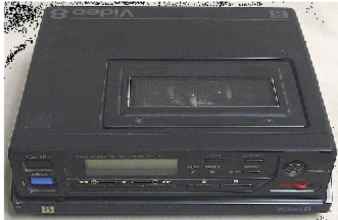
Resim 1.16: 8mm okuyucu