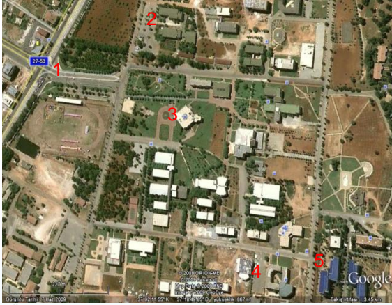
1-Üniversite Giriş, 2-Fizik Mühendisliği Bölümü, 3-Rektörlük, 4-Kongre Merkezi, 5-Kredi ve Yurtlar Kurumu

Alternatif Öneriler için web adresimizi ziyaret ediniz.